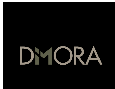
Versione in negativo a colori

The image shows the word 'DIMORA' in a bold, sans-serif font. The letters are black, and the background is white. This is the positive black and white version of the logo.