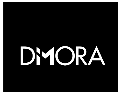
Versione in negativo in B/N